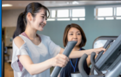
②お客様のご要望に合わせて何でも ご相談ください。 スタッフが施設をご案内いたします。