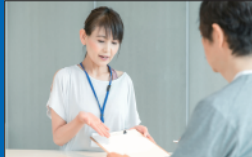
①フロントにて受付

ご利用目的やご利用時間などを伺った上で、お客様のご要望に合わせてご案内いたします。